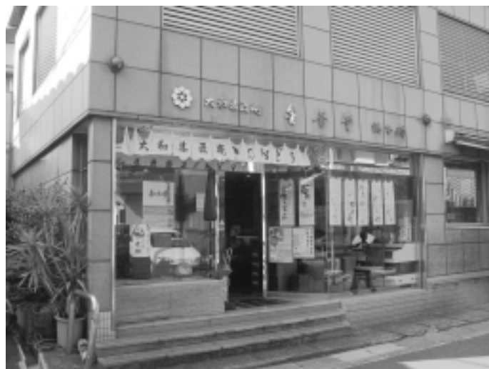
王寺町にある本店