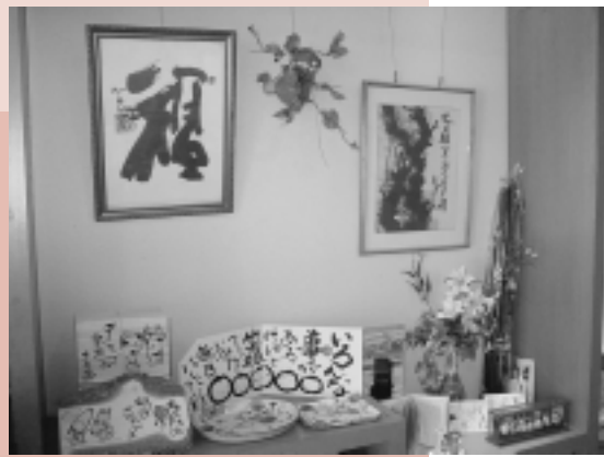
店内には陶芸家や書道家の方々の作品が所狭しと置かれている。

同社の和菓子を通した様々な提案が、希薄になりつつある人と人のコミュニケーションをつなぐツールとなることが期待されます。